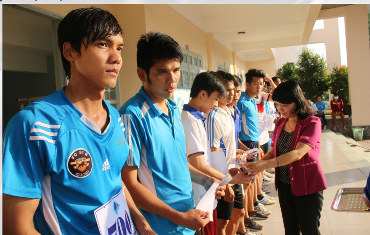
Trao thưởng cho VĐV đạt giải thi Chạy việt dã.

Ngay sau phần khai mạc Hội thao là phần tham gia thi đấu mở màn với môn Chạy việt dã. Góp phần tạo nên bầu không khí sôi nổi, hào hứng của phiên khai mạc Hội thao, Ban Tổ chức đã trao thưởng cho các VĐV đạt giải Chạy việt dã ngay sau khi kết thúc môn thi với gần 80 giải thưởng, gồm các giải Nhất, Nhì, Ba, Khuyến khích, kết hợp với chương trình bốc thăm giải May mắn với cơ hội dành cho tất cả các VĐV tham gia thi đấu môn Chạy việt dã.