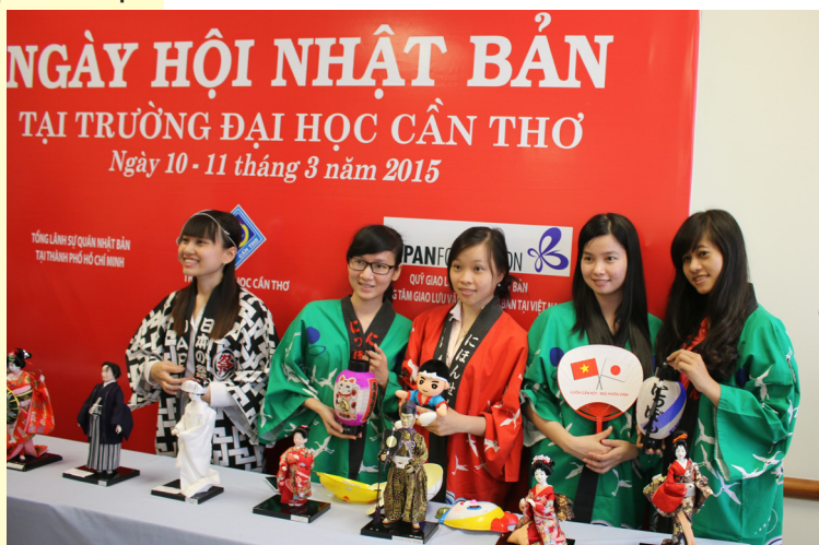
Cùng lưu lại những khoảnh khắc khó quên!

Ngày hội giao lưu văn hóa Nhật Bản đã phần nào đáp ứng khát khao tìm hiểu về nền văn hóa nước bạn của sinh viên Trường. Trong bối cảnh hội nhập quốc tế ngày càng sâu rộng, chương trình đã tạo động lực cho các em sinh viên nỗ lực trau dồi kiến thức và hiểu biết của mình về thế giới, đặc biệt là nâng cao trình độ ngoại ngữ để hội nhập môi trường làm việc tương lai, đồng thời tích cực giao lưu học hỏi cùng bạn bè quốc tế.