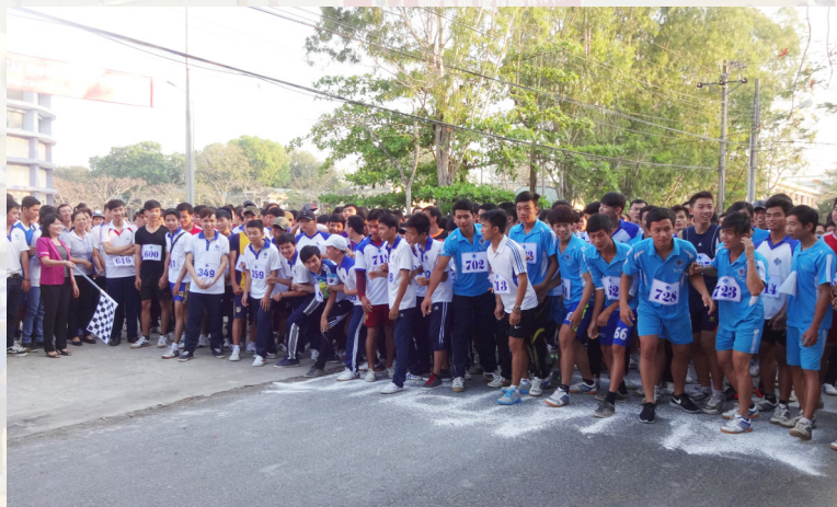
Thi đấu mở màn nội dung Chạy việt dã.