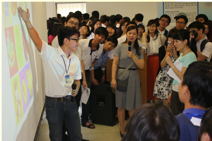
Hào hứng tham gia chương trình Đối vui.

N gày 10 và 11/3/2015, Chương trình giao lưu văn hóa với chủ đề “ Ngày Hội Nhật Bản ” đã sôi nổi diễn ra tại Trường Đại học Cần Thơ (ĐHCT) dưới sự phối hợp tổ chức của Tổng lãnh sự Nhật bản tại Thành phố Hồ Chí Minh và Quỹ Giao lưu Quốc tế Nhật Bản (Japan Foundation).