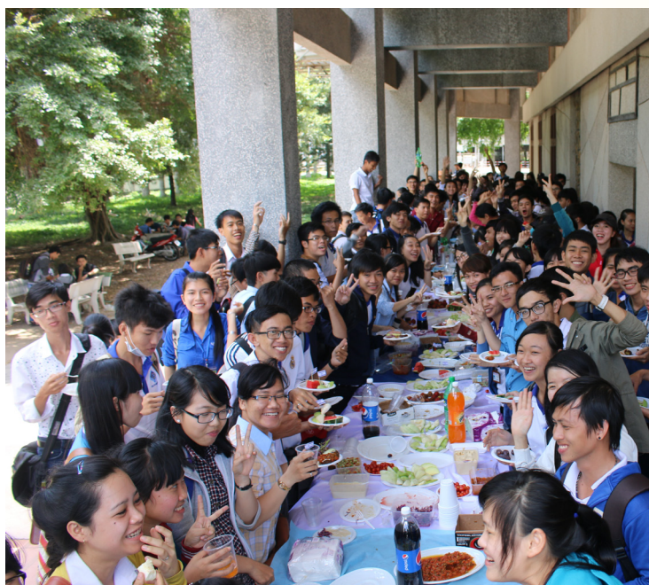
Giao lưu và thưởng thức ẩm thực Israel.

đó, các em sinh viên tự rút ra những bài học hữu ích cho bản thân mình, ý thức được trách nhiệm của bản thân, là phải học thật tốt để đưa những kỹ thuật tiên tiến, hiện đại vào phát triển kinh tế nước nhà, đặc biệt là lĩnh vực nông nghiệp-tiềm năng, thế mạnh của quê hương Đồng bằng sông Cửu Long và của quốc gia, với thông điệp “Đừng hỏi Tổ quốc đã làm gì cho ta, mà cần hỏi ta đã làm gì cho Tổ quốc hôm nay”.