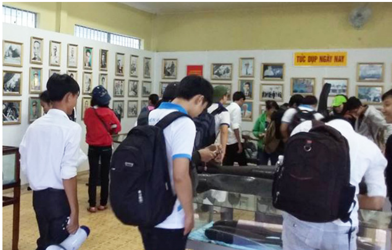
Tham quan Nhà truyền thống tại Đồi Tức Dụp.