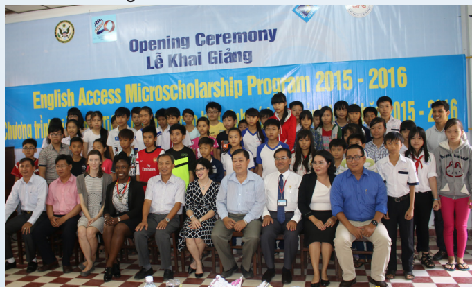
Ảnh lưu niệm cùng các em học sinh.