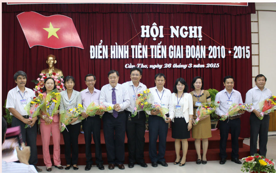
Tặng hoa chúc mừng cho các nhà giáo đạt chuẩn chức danh Giáo sư và Phó Giáo sư.

Ngày 26/3/2015, Trường Đại học Cần Thơ (ĐHCT) đã tiến hành Hội nghị Điển hình tiên tiến giai đoạn 2010-2015. Dự Hội nghị có các thành viên Ban Thường vụ (BTV) Đảng ủy, Ban Giám hiệu; BTV Công đoàn Trường, Hội Cựu chiến binh và Đoàn TNCS Hồ Chí Minh; đại diện lãnh đạo các đơn vị trong Trường; viên chức được vinh danh, khen thưởng.