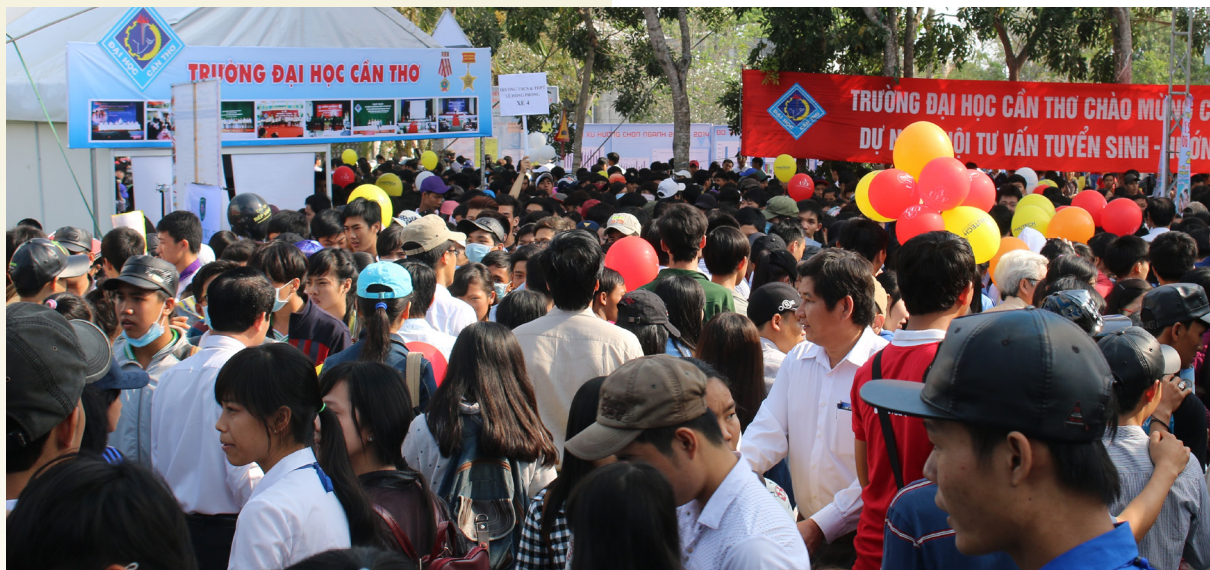
Khu vực tư vấn của Trường ĐHTC thu hút đông đảo các em học sinh.

Ngày 08/3/2015, Bộ Giáo dục và Đào tạo (GD&ĐT), Sở GD&ĐT Thành phố Cần Thơ, Báo Tuổi trẻ đã phối hợp với Trường Đại học Cần Thơ (ĐHCT) tổ chức Ngày hội Tư vấn Tuyển sinh-Hướng nghiệp (TVTS-HN) năm 2015 trong khuôn viên Trường ĐHTC. Tham dự chương trình tư vấn có 120 trường đại học, cao đẳng, trung cấp chuyên nghiệp tại Thành phố Cần Thơ và Thành phố Hồ Chí Minh.