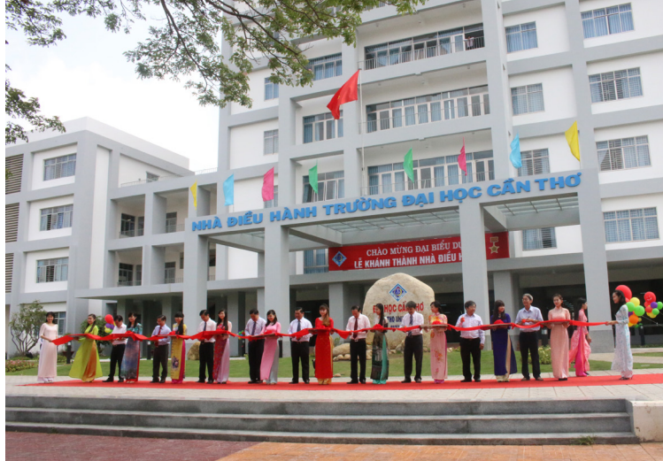
Cắt băng khánh thành Nhà Điều hành Trường ĐHCT.

Nhân dịp kỷ niệm 49 năm thành lập, Trường ĐHCT đã chính thức công bố quyết định thành lập Khoa Ngoại ngữ. Việc thành lập và triển khai hoạt động của Khoa Ngoại ngữ có ý nghĩa rất quan trọng, nhằm thực hiện chủ trương của Bộ GD&ĐT về tăng cường hiệu quả công tác dạy