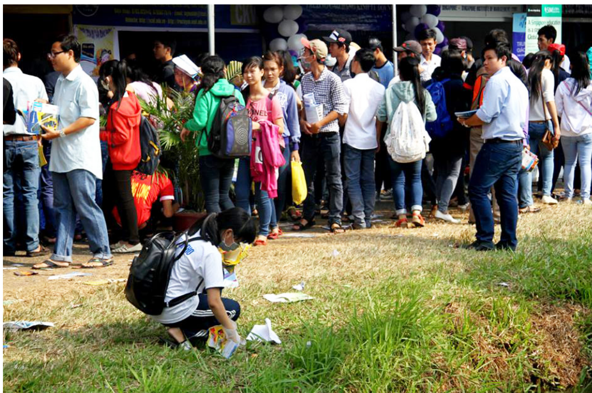
Sinh viên Trường ĐHTC cặm cụi nhặt rác, tờ rơi.

Tôi tự rút ra được bài học cho riêng bản thân mình và tự dặn lòng lấy anh chị làm gương. Mai này, dù bao nhiêu năm tháng trôi qua, tôi sẽ vẫn nhớ mãi những con người hôm nay gieo cho tôi mầm non hi vọng-hi vọng trên những màu áo tươi xanh-màu áo Đại học Cần Thơ!